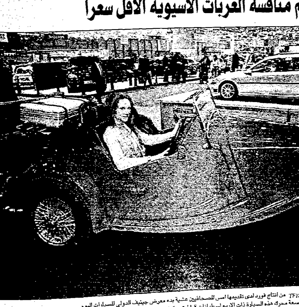
سيارة مينيال TFI 1800 من إنتاج فورد لتقدمها اسس للمصانع عيشة بدء عرض جينيف الدولي للسيارات اليوم...